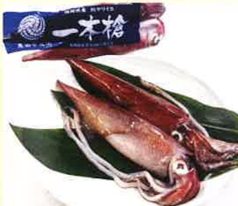
福岡県漁業協同組合連合会 一本槍いか（剣先いか）