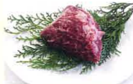
株式会社エンリッチ 豊作和牛(サガリ)