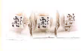
株式会社 四万十ドラマ きんとん栗林