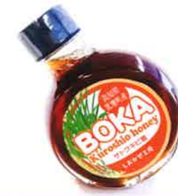
株式会社友栄（しおかぜ工房） ボカ（さとうきび蜜）

糸島の海の恩恵を受けて育った牡蠣は、ネーミングとは裏腹にシーズンを通して独特なクセが無く何個でも食べたくなる牡蠣と、老若男女問わず好評いただいております。生産する上での1番のポイントは身入りに来るため、年々変化していく海の状況に合わせて毎年養殖方法を微調整対応しております。