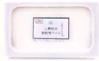
株式会社エスプリ 上善如水酒粕雪アイスマイルク