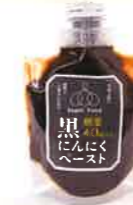
まざあーずうおーむ株式会社 黒にんにくペースト