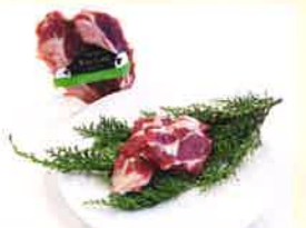
株式会社ふじさん牧場 ふじさんワインラム (精肉)