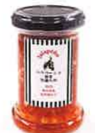
こびらオリーブ園 ハラペーニョ 旨辛万能だれ Red