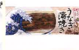
株式会社万隆商事 愛知県産新子70尾-60尾