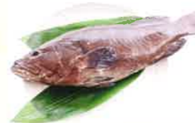
高浜水産業振興協議会 (高浜町産業振興課内 事務局) SHE SO (まはた)