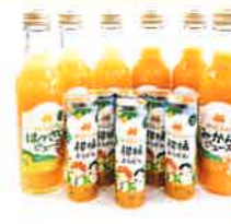
みかんのみっちゃん農園 みかんのみっちゃん農園の ギフトBOX (仮)