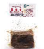
合同会社土佐あぐりーど 土佐あかうし薬焼きローストビーフ