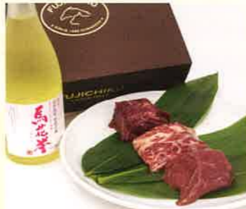
株式会社フジチク 馬刺しと焼酎の 晩酌セット【松】