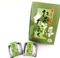
株式会社伊藤久右衛門 宇治抹茶だいふく