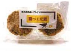
株式会社西尾 鶏つくだ煮