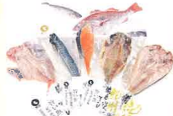
株式会社紀州高下水産 紀州備長炭熟成干物セット