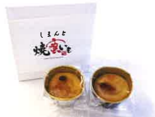
菓子工房コンサルト しまんと焼密芋（4個入）