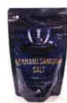
赤穂あらなみ塩株式会社 ARANAMI SAMURAI SALT