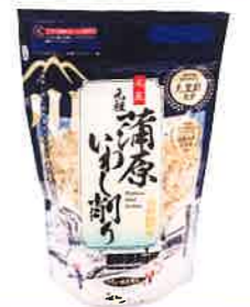
有限会社西尾商店 蒲原いわし削り

黒潮町産のサトウキビの搾り汁を煮詰めた蜜です。煮詰める過程で泡が大きくなり「ボカッボカッ」と音を出して弾けることから「ボカ」と呼ばれています。黒蜜とは異なり、100%サトウキビエキスです。