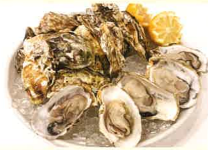
株式会社アクアグローバルフーズ 福岡県糸島産みるくがき

糸島の海の恩恵を受けて育った牡蠣は、ネーミングとは裏腹にシーズンを通して独特なクセが無く何個でも食べたくなる牡蠣と、老若男女問わず好評いただいております。生産する上での1番のポイントは身入りに来るため、年々変化していく海の状況に合わせて毎年養殖方法を微調整対応しております。