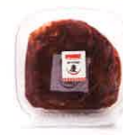
デリター株式会社 おつけもの慶コラボ、 三浦サーモンキムチ