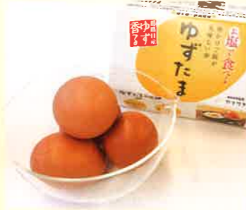
ヤマサキ農場株式会社 ゆずたま