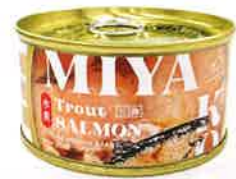
有限会社丸福 宮古トラウトサーモン水煮