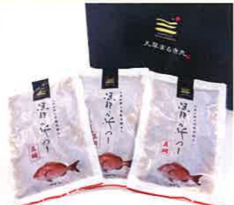
丸木水産漁業株式会社 漁師の沖めし真鯛