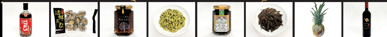
会稽山紹興酒(株) 紹興酒会稽山1743 活鮮あわび 殻・内臓付き 43/53g 10個入 (株)KANEYUKI商事 殻・内臓付き 黒はちみつ 180g (有)シタール インド産 黒はちみつ 180g (有)シタール グリーンカルダモン 43/53g (有)シタール タマリンドペースト (有)シタール ロングペッパー (株)スミフルジャパン 甘熟王ゴールド プレミアムパイン (株)Royal Georgia GEORGIAN サベラヴィ2021/赤辛口