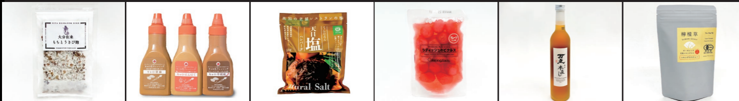
おおいた在来作物研究会 大分在来もちとうきび麴 雅福恵舎(株) キャロ生ドレッシング 3本セット カフェダイニングマリソル 黒毛和牛と四万十ポークの 天日塩ハンバーグ自家製黄金生姜ソース付 (株)カラーリングファーム ラディッシュの ピクルス プレーン キッコマン食品(株) 万上 流山本直し (有)グリーンティ五島 レモングラスティー