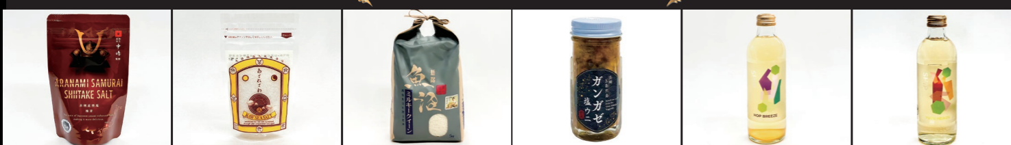
赤穂あらなみ塩(株) ARANAMI SAMURAI SHIITAKE SALT 天と0と地 (あとれとわ) あとれとわの塩 天日結晶化 塩蔵静置海塩 2年 (株)うおめま小岩農園 魚沼産特別栽培 ミルククイーン うた丸 ガンガゼ塩ウニ (株)大泉工場 SHIP KOMBUCHA HOP BREEZE (株)大泉工場 SHIP KOMBUCHA YUZUHEADS