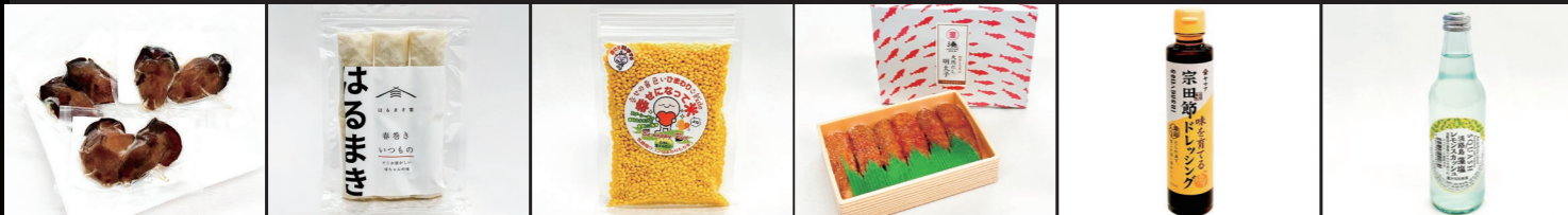
(有)播磨海洋牧場 Smoked oysters(燻製牡蠣) はるまき家 金澤春巻き いつもの (有)マインドバンク 幸せになって米(よね) 湊水産(株) 鰹節と昆布の天然だし明太子 (有)ヤマア 土佐清水宗田節味を 育てるゆずドレッシング ユーアールエー(株) 淡路島藻塩レモンスカッシュ