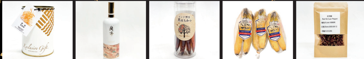
EASE BIOTECHNOLOGY CO.,LTD. Original Dried Cheese Strips 会稽山紹興酒(株) 紹興酒 蘭亭 国潮 (有)シタール インド産 野生黒はちみつスティック (株)スミフルジャパン 甘熟王ゴールド プレミアムバナナ (株)東輝 四川省産紅花椒 (1級2級品ブレンド)